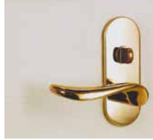
間仕切錠 (ゴールド)