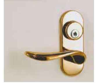
シリンダー錠 (ゴールド)